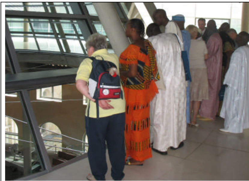
Eine Gruppe von Naturfreunden aus dem Senegal in der Reichstagskuppel.

Berlin bietet mit seinen zahlreichen Museen, Ausstellungen, Messen, Konzerten und anderen Highlights mehr als bloß die Behörden einer Bundeshauptstadt. Deswegen melden sich neben Schülergruppen, die sich oft sehr gut vorbereitet haben, auch Vereine und Seniorengruppen, Frauen, ganze Familien und Einzelpersonen in meinen Büros in Berlin oder in Ludwigshafen. Sie wollen neben anderen Unternehmungen, die sie in Berlin vorhaben, gerne auch das politische Berlin kennenlernen. Und wie wäre das besser als mit sachkundigen Erläuterungen, am besten durch die eigene Abgeordnete! Meine Mitarbeiterinnen und Mitarbeiter finden meistens eine Lösung, die ein Treffen mit mir möglich macht.